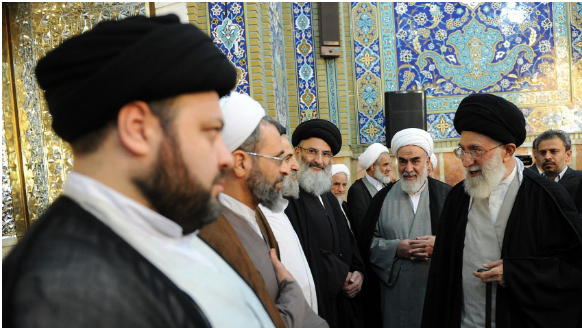
رهبر ایران در دیدار با علیرضا اعرافی رئیس جامعه المصطفی

«جمهوری اسلامی ایران سعادت انسان در کل جامعه بشری را آرمان خود می داند، و استقلال و آزادی و حکومت حق و عدل را حق همه مردم جهان می داند، بنابراین در عین خودداری از دخالت در امور داخلی ملت های دیگر، از مبارزه حق طلبانه مستضعفین در برابر مستکبرین، در هر نقطه از جهان حمایت می کند.» (اصل ۱۵۴ قانون اساسی). ۵