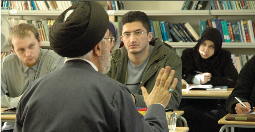
جامعه المصطفی و تلاش برای تبلیغ تشیع

” اومد عے است تشکیلات جامعه المصطفیٰ از منچسترون یونیورسٹی مادگلس کارو کاس تاریکا امتداد یافتہ و مے گوید: ۲۵ » برکات خون شہیدان بے شمار است اما اگر بگوئیم جمہوری اسلامے این تعداد شہیدو جانباز دادہ و فقط ثمرہ اش شدہ کاری کہ در جامعه المصطفیٰ (ص) شدہ کہ حدودین جاہ میلیون نفر در سراسر جهان شیعه شدہ اند و پیام اسلام و معارف الہی و اہل بیت (ع) در سراسر دنیا منتشر شدہ است کفایت مے کند.»