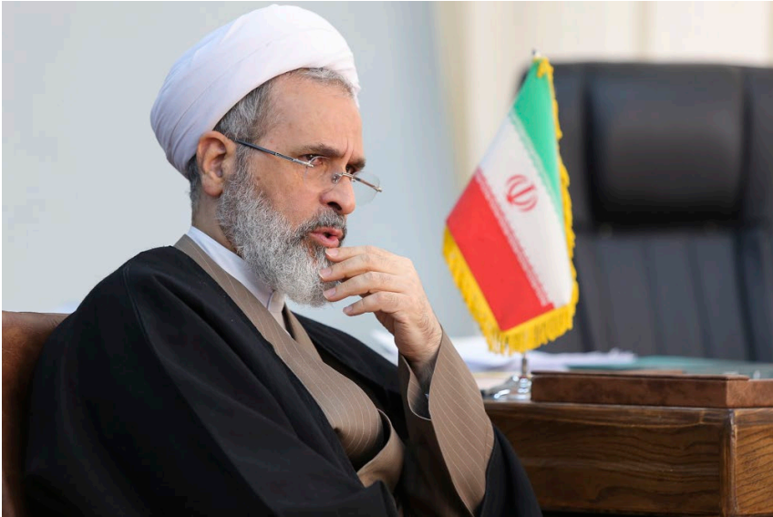
اعرافى؛ مجرى دستگاہ شیعه و مجاهد پرورى نظام ولایى

تا پیش از ورود جنبش انصار حزب الله به مبارزه در یمن و اعزام مدافعان حرم به سوریه، کمتر نگاه‌ها متوجه «جامعه المصطفی العالمیه» و نقش رئیس آن «آیت الله علیرضا اعرافی» در جنبش‌های اسلامی-جهادی در منطقه خاورمیانه و شمال آفریقا بود، به عبارتی کسی چندان متوجه دستگاہ «شیعه پروری» و «مجاهد پروری» حوزه علمیه قم نبود. اما پس از اعزام دو تیپ فاطمیون (رزمنده های افغان) و زینبیون (رزمنده های پاکستانی) مرکب از فارغ التحصیلان دانشگاه جامعه المصطفی العالمیه به سوریه و بازگرداندن جنازه های آنها، نگاه‌ها بیش از پیش به فعالیت‌های آیت الله اعرافی متمرکز شد.