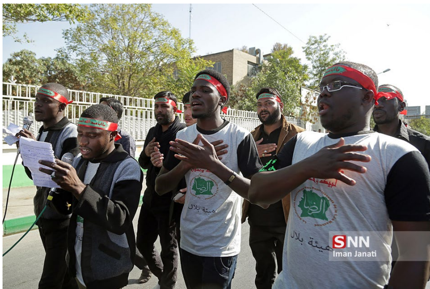
دسته عزاداری طلاب خارجی جامعه المصطفی العالمیه در مشهد