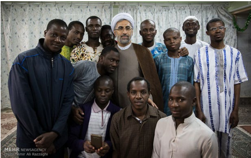
تمرکز جامعه المصطفی بر کشورهای آفریقایی