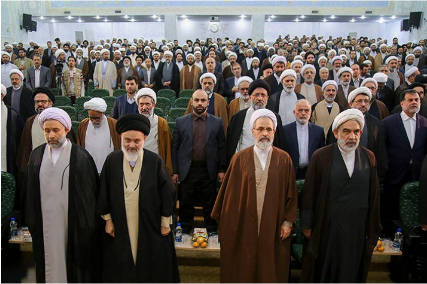
مراسم تودیع ریاست جامعه المصطفی العالمیه

این نهاد تحت نام دانشگاه با اخذ مجوز از شورای عالی انقلاب فرهنگی و وزارت علوم، تاسیس شد.