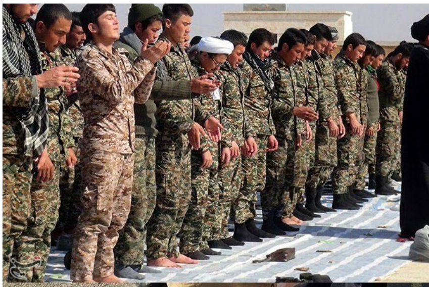
گردان فاطمیان یک نیروی شبه نظامی وابسته به سپاه قدس و متشکل از شیعیان افغانستان است

مدونین قانون اساسی، ایده بنیانگذار جمهوری اسلامی در خصوص ضرورت صدور انقلاب را اینگونه در قانون اساسی گنجانده و لی این ایده به نهادی اجرایی نیازمند بود. طبیعی است که وزارت امور خارجه به عنوان دستگاه دیپلماسی به صورت رسمی قادر به ایفای ماموریت صدور انقلاب نبود بنابراین این ماموریت به نهادهای غیررسمی یا غیر دولتی واگذار شد. جامعه المصطفی العالمیه یکی از این نهادها بود که عهده دار صدور انقلاب شد. در بیان اهداف و ماموریت‌های این نهاد که در سال ۸۸ به دانشگاه تغییر نام داد آمده است ؛ ۶ «جامعه المصطفی العالمیه نهادی علمی و بین المللی با هویت حوزه‌ای است که با هدف گسترش علوم اسلامی، انسانی و اجتماعی، با رویکرد آموزشی، پژوهشی و تربیتی، اهتمام دارد که انبوهی از داوطلبان را از سراسر گیتی تحت پوشش قرار دهد و فرصت کم نظیری برای تشنگان زلال معارف اسلامی و هدایت قرآنی در سراسر جهان فراهم آورد تا ضمن تربیت مجتهدان، عالمان و متخصصان پارسا و متعهد، به تبیین، تولید و تعمیق تفکرات و اندیشه‌های اسلامی و نشر و ترویج اسلام ناب محمدی همت گمارد.»