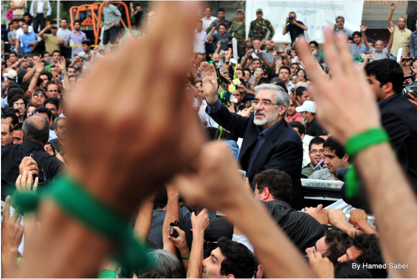
اعرافی، موسوی و کروبی را سران فتنه می نامد و گناه آنان را بزرگ می شمارد

اعراف رهبران جنبش سبز را فریب خورده می خواند و می گوید: ۲۹ «در تلاش دشمنان در خدشه وارد کردن به انتخابات سالم و باشکوه ملت ایران در سال ۱۳۸۸ کسانی که به عنوان سران فتنه شناخته می شوند انقلاب اسلام، امام و رهبری را به بهانه های یوچ و خیالی فروختند و گناه بزرگ را مرتکب شدند.»