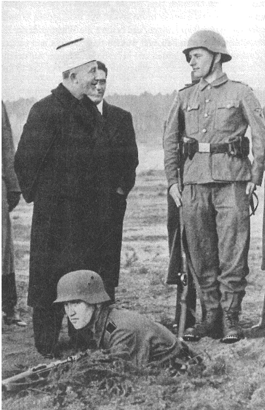
Amīn al-Ḥusainī bei der 13. (bosnisch-herzegowinischen) Waffen-Gebirgsdivision der SS

(Quelle: PArchAAB, R 27322, Bl. 390953-390955; ebenda, Inland IIg, Waffen-SS: Kroatien, Fiche 2575, Bl. E464784-E464786; Israel State Archives, Jerusalem, Mufti War Time Papers, Bl. 2778-2780)