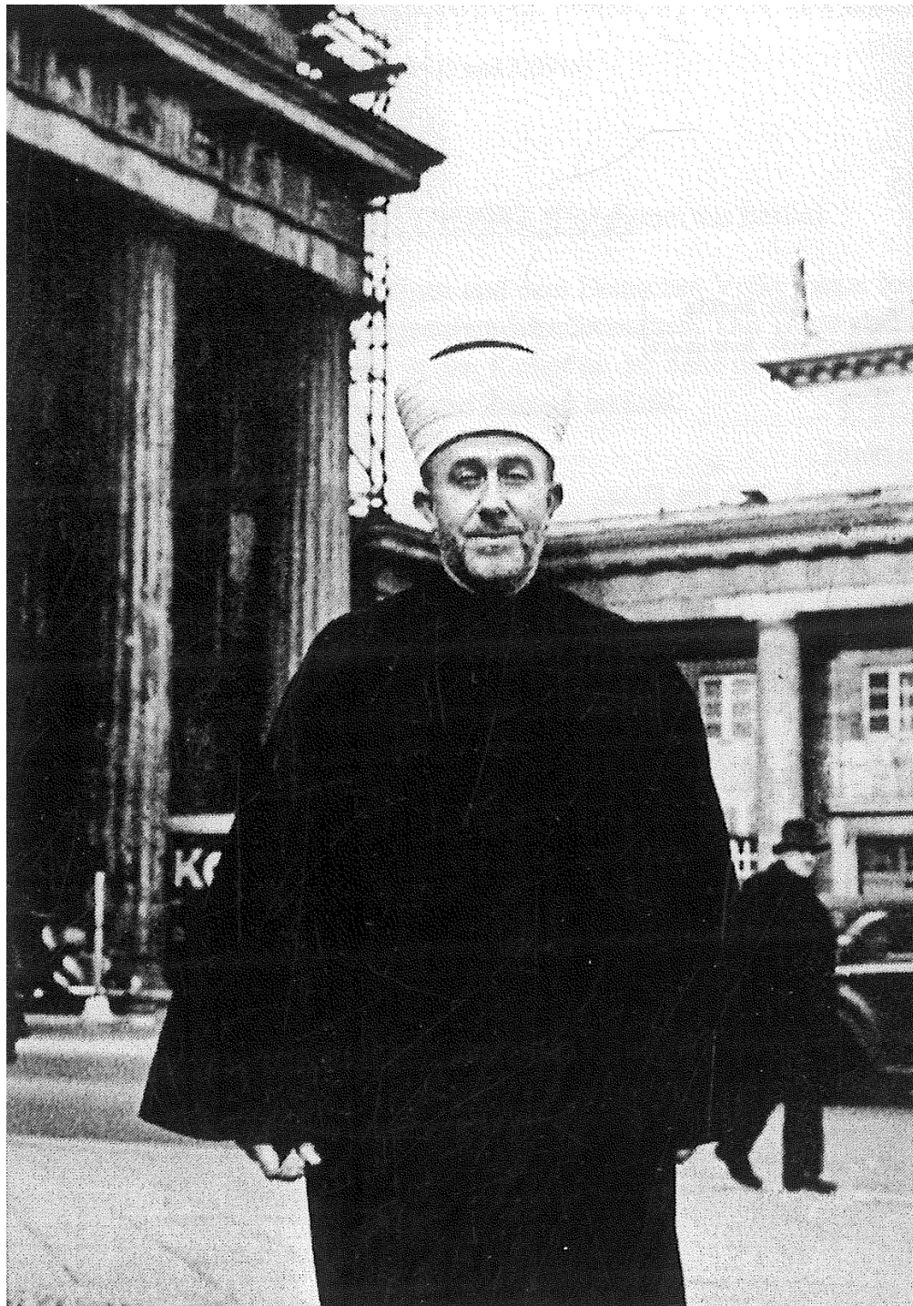
Amīn al-Ḥusainī am Brandenburger Tor