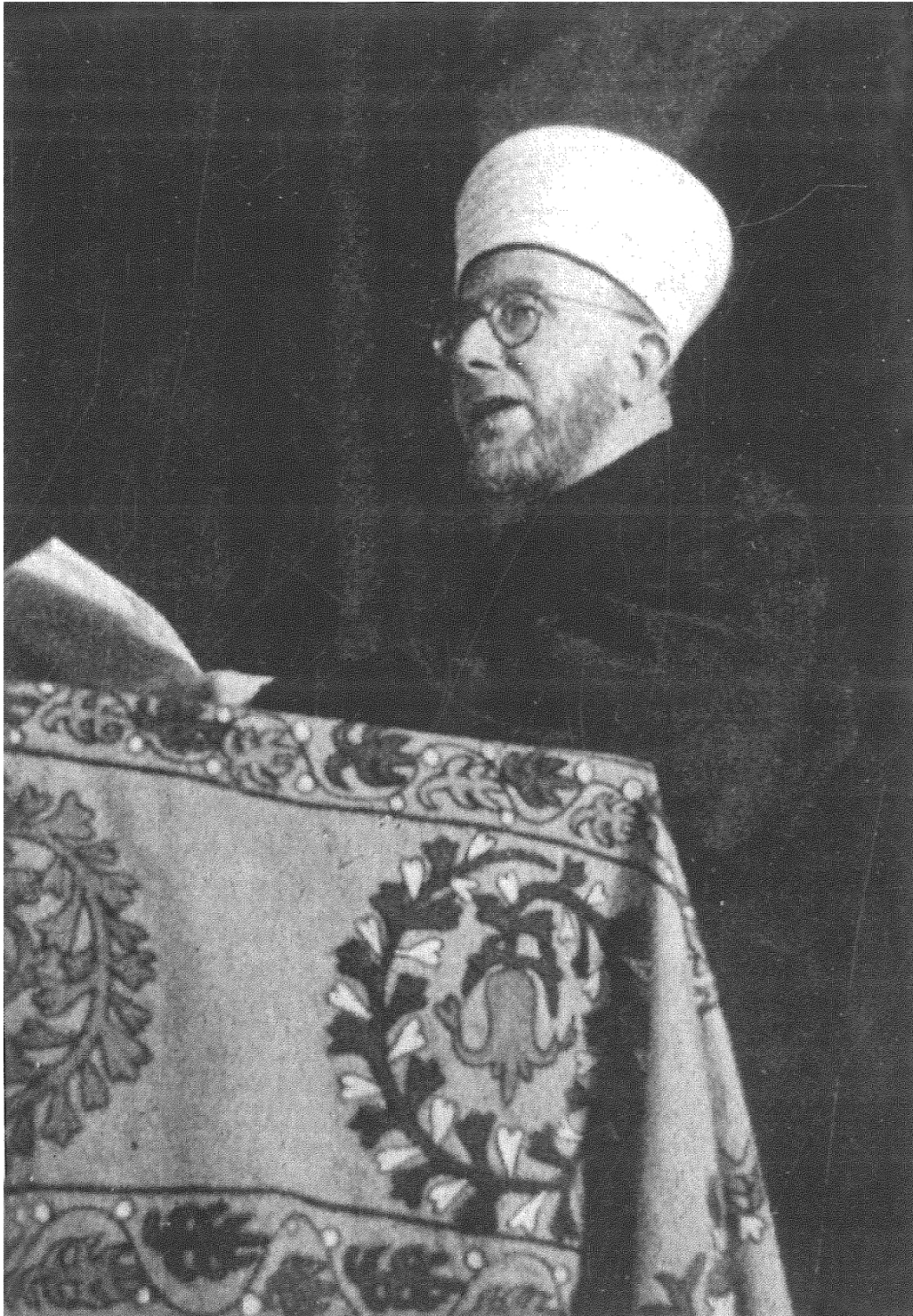
Amīn al-Ḥusainī in der Berliner Moschee