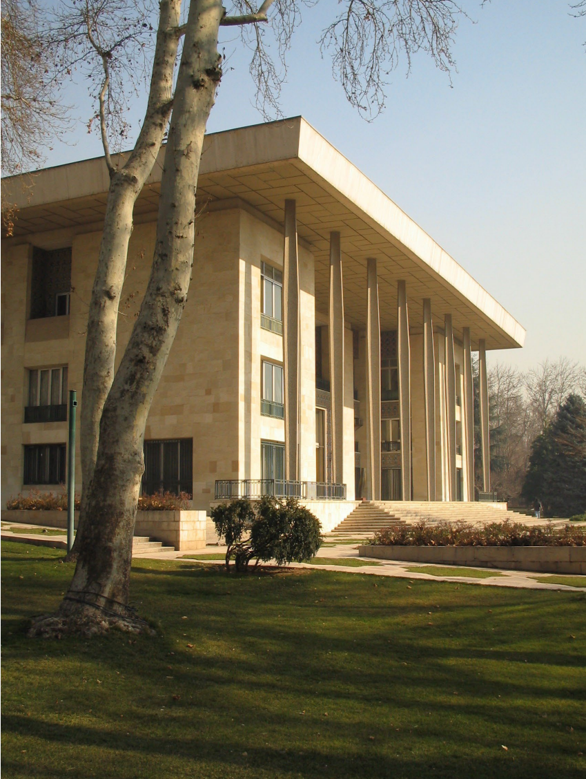
کاخ نیاوران: این کاخ در مجموعه باغ نیاوران در میدان نیاوران تهران واقع شده که پس از انقلاب به مصادره نیروهای انقلابی درآمد.

به این اموال فرهنگی مصادره شده می توان به مجموعه بزرگ شهربازی ارم تهران، بولینگ عبده تهران و مجتمع تفریحی توچال اشاره کرد که بنیاد مالکیت آنها را تصاحب کرده است.