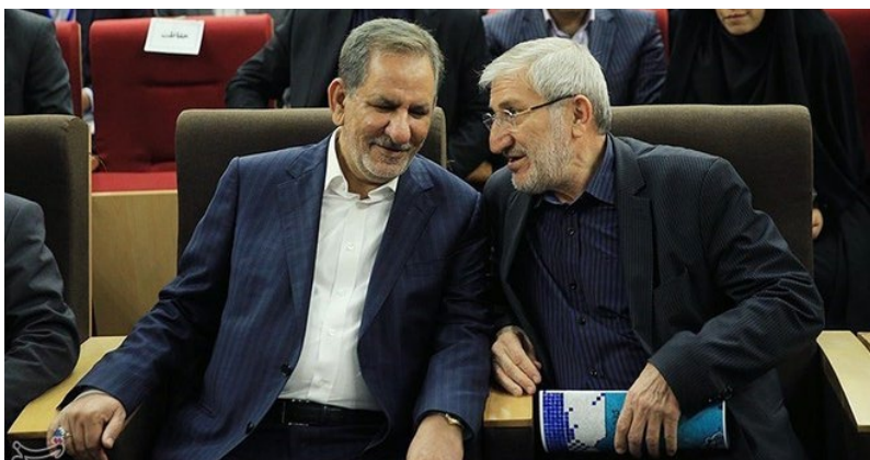
سعیدی‌کیا (سمت راست تصویر) در کنار اسحاق جهانگیری از چهره‌های شاخص اصلاح‌طلبان و معاون اول حسن روحانی

او در بیان ملاک انتخاب مدیران اش در طول سال‌ها وزارت می‌گوید: «قبل از انتصاب افراد می‌پرسیدم آیا او با وصیت‌نامه و راه و روش امام (ره) و ولایت فقیه و قانون اساسی و ارزش‌های انقلاب منطبق بوده یا خیر؟ ملاک من اینگونه بوده نه اینکه فقط ببینم طرف متخصص هست یا نه.»