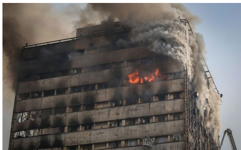
آتش سوزی در ساختمان پلاسکو

صبح روز ۳۰ دی ماه ۱۳۹۵ وقوع آتش سوزی مهیب در پلاسکو و شعله ور شدن آتش در عین حال که به ویرانی این ساختمان تاریخی در تهران منجر شد ولی نوری بود بر حقایق پنهان مانده بنیاد مستضعفان. بنیادی