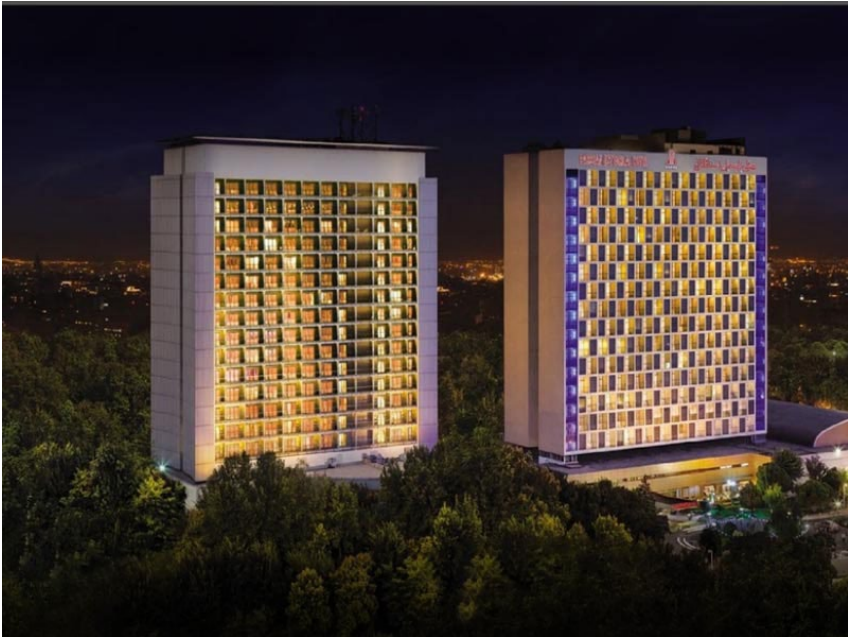
هتل استقلال: نام این هتل در گذشته رویال هیلتون تهران بود که پس از انقلاب مصادره شد و در اختیار بنیاد مستضعفان قرار گرفت.

از نظر میزان درآمد نیز رقم اعلام شده برای درآمد حاصل از فروش کالا و خدمات در سال ۱۳۹۵ بیش از ۲۸۳۵۰ میلیارد تومان بوده که حدود ۳۵٪ آن ناشی از فروش کالا عمدتاً در بخشهای صنایع غذایی و کشاورزی، نفت و انرژی و صنعت و معدن و حدود ۶۵٪ ناشی از ارائه خدمات عمدتاً در بخشهای خدمات مالی و بانکی، فناوری اطلاعات و صنعت و معدن بوده است. نهایتاً میزان سود خالص بنیاد در سال ۱۳۹۵، ۲۷۰۰ میلیارد تومان و سود انباشته سنواتی آن بیش از ۱۳۸۰۰ میلیارد تومان برآورد گردیده است. اعدادی که در صحت آن باید تردید کرد.