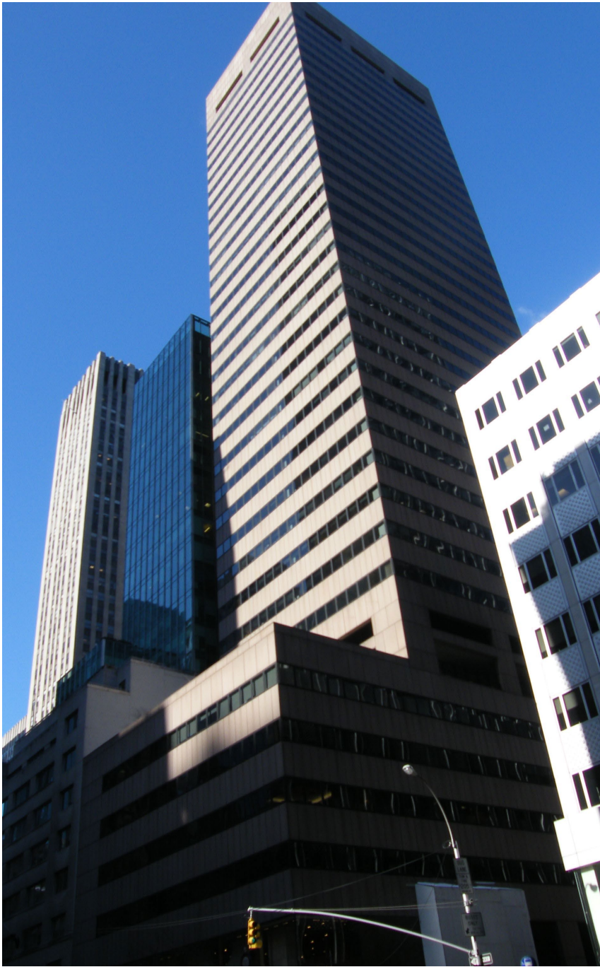
برج ۶۵۰ خیابان پنجم، یک آسمان خراش شهر نیویورک متعلق به بنیاد پهلوی، مصادره شده توسط بنیاد مستضعفان